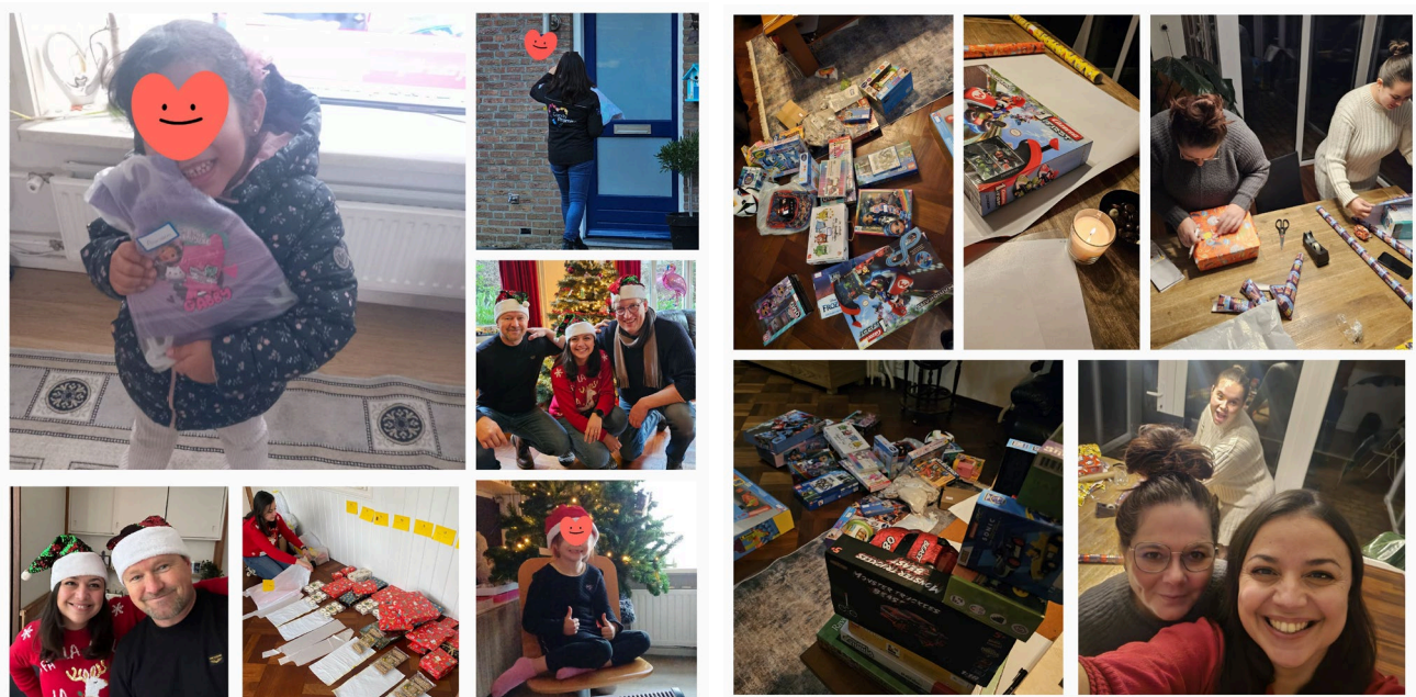
Foto: sfeerimpressie project Winter Wens 2024

Omdat financiële problemen en armoede vaak gepaard gaan met gevoelens van schaamte, hebben we ervoor gekozen deze hulpactie zonder verdere social media-aandacht uit te voeren. Op deze manier konden we gezinnen op een respectvolle en vertrouwelijke manier ondersteunen.