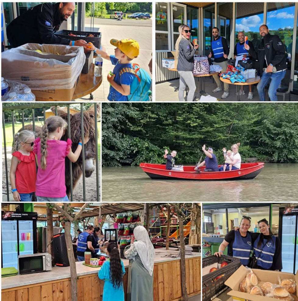
Foto: sfeerimpressie Steinerbos

Als dank en aandenken ontvingen alle gezinnen een goedgevulde goodiebag met handige spullen voor thuis. Dit uitje bracht niet alleen veel plezier, maar versterkte ook de banden binnen de gemeenschap – precies waar wij als organisatie naar streven.