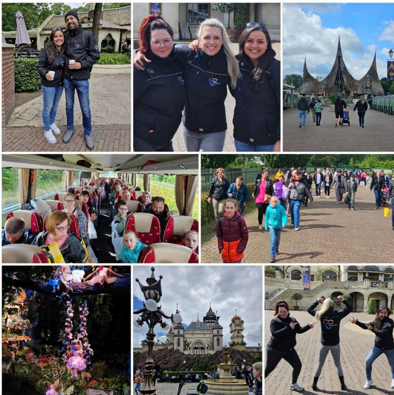
Foto: verzamelen foto's van het uitje

Het was een mooie dag, zonder incidenten. Dit uitje was een groot succes en blijft een vast project voor Candy Promise.